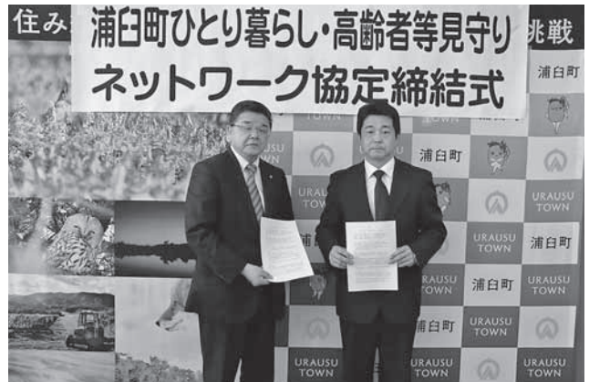
株式会社ビジコー浦臼営業所 様