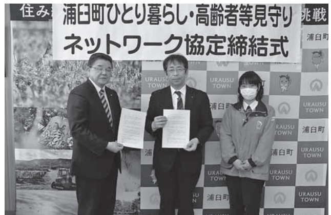
岩見沢ヤクルト販売株式会社 様

【お問い合わせ先 浦臼町地域包括支援センター（長寿福祉課介護福祉係） 電話68-2288】