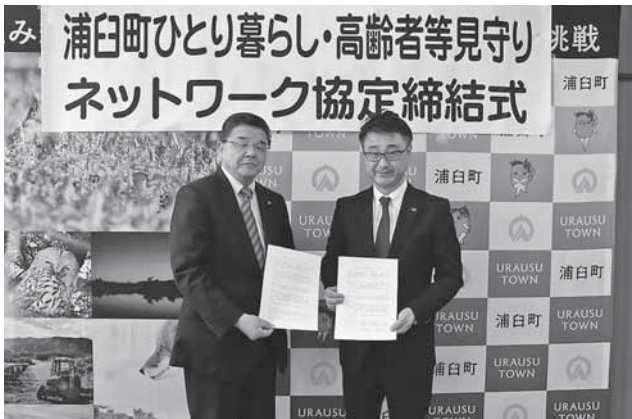
株式会社ダスキン滝川 様