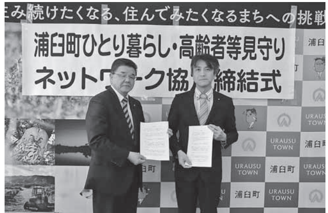
北門信用金庫浦臼支店 様