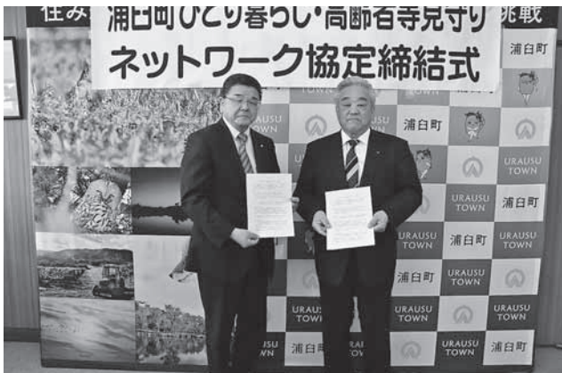
ピネ農業協同組合 様