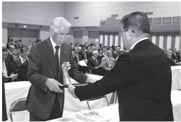
町政功労者はじめ、表彰が行われました。