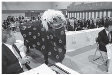
本山町獅子舞保存会による舞踊が披露されました。