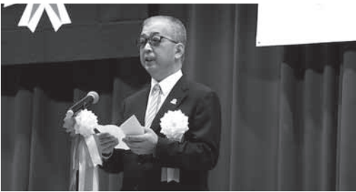
本山町の細川町長より祝辞をいただきました。