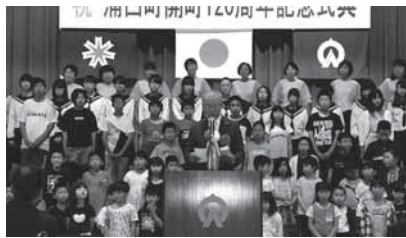
式典の最後に、小松議長より決意表明がありました。