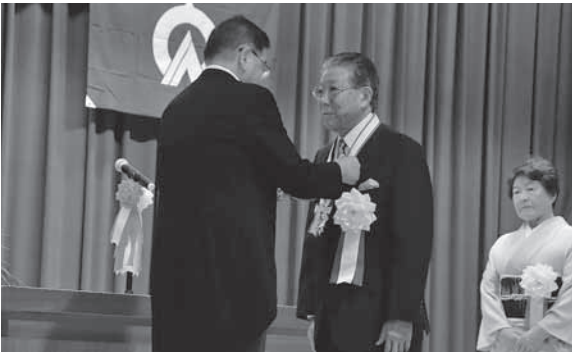
5代目町長の山本要氏へ名誉町民章が贈られました。