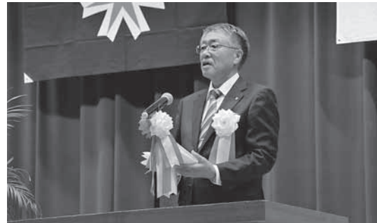
月形町の上坂町長より祝辞をいただきました。