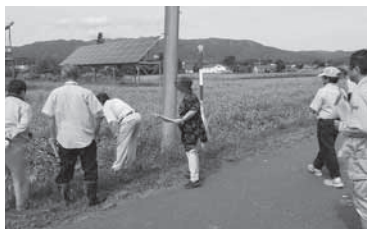
宮農型太陽光発電転用許可