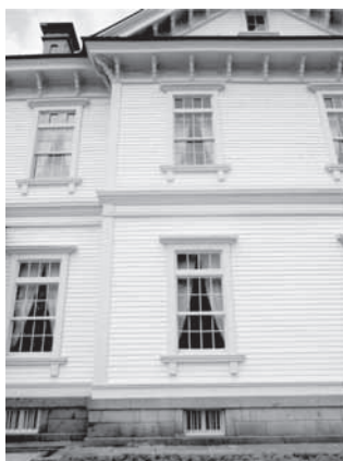
▲「豊平館」こちらは白とウルトラマリンブルーのペンキ塗りの「館」と同じ上げ下げ窓