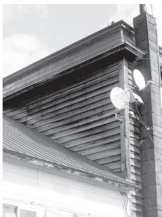
▲「館」何も塗っていない素地の下見板

外観は洋風ですが、構造は和風で昔からある木造軸組みというものです。そして特徴的なのが「土塗り壁」本来、竹を組んだ「木舞」に土を塗って壁にしますが、北海道などの寒冷地ではなかなか竹が取れないので「葦」で代用しています。町内の同年代の建物でも同じ造りがみられました。葦は竹よりも強度が弱いので竹の場合よりも間隔を細かくして、束ねて土壁の下地にしています。北国ならではの工夫を感じますね。