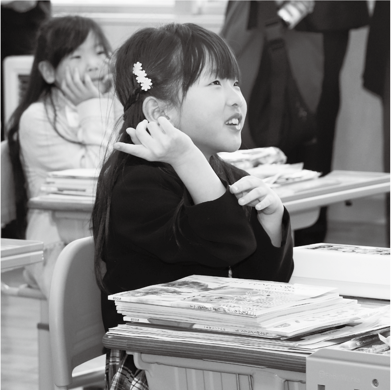
浦臼小学校入学式