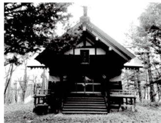
▲現在の幾春別神社

上にも書きました通り、現在の浦臼神社の社殿は昭和47年に三笠市の幾春別住友奔別神社の社殿を移築してきたものになります。移築してからは50年ほど経ちましたが、社殿自体はそれ以上の長い歴史を有していることになります。初代と比べると全く形が違いますね！現在の幾春別神社とも比べると結構似ているかも…？