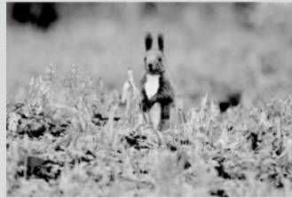
▲境内の花とエゾリス