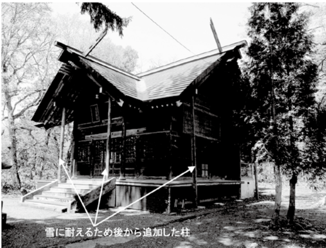
雪に耐えるため後から追加した柱

去年の浦臼の大雪は凄まじかったですね！私は役場の2階まで迫った雪に驚きました。神社建築で共通して特徴的なのは「屋根が大きく、軒の出が大きい」ことにあります。それが大雪とどんな関係があるかと言いますと、軒の出が大きいほど雪が載る重量も大きくなり先端側が歪んだり折れてしまう恐れがあります！しかも、浦臼神社（というか北海道の神社のほとんど）は切妻屋根を十字に直交させた屋根形状になっているので谷の部分に雪が溜まって落雪しにくくなっています。神社建築は豪雪地帯と相性がとても悪いんですね…。浦臼神社は軒先を支える3本の丸太柱を増設し大雪対策をしているようです。去年の大雪はこの3本が頑張ったのでしょうか。