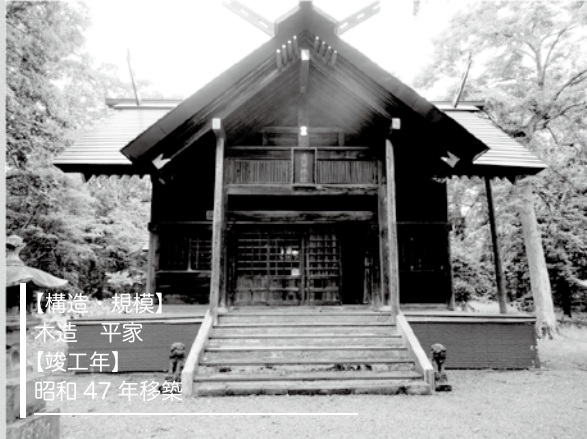
【構造・規模】 木造 平家 【竣工年】 昭和47年移築