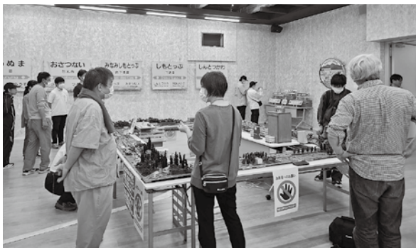
ありがとう札沼線フェスタ（5月17～19日開催）

そのため、生産者の皆様にはお時間をいただくことには思いますが、ご協力いただけますと幸いです。