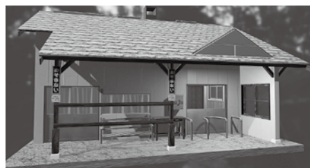
（晩生内駅3Dモデリング）