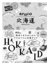
『aruco 北海道』 地球の歩き方

友達0人の陰キャラ高校生、橘海人は、「人の心に棲みつく魚がみえる」という能力を持つ。クラスメイトの桜庭澄歌と出会い、巨大なクジラに果敢に挑むファンタジー。