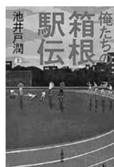
『俺たちの箱根駅伝』上・下 池井戸 潤 著

箱根駅伝本選での活躍を目指す、大学陸上競技部の青葉隼人ら、ランナーたちと、中継を担うテレビ局の裏側を描く、群像劇。箱根を走り切ることができるのか？