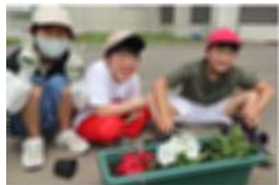
札幌法務局滝川支局、浦臼町役場の皆様にご協力いただき「人権の花運動」を行いました。「人権まもるくん」も来てくれました