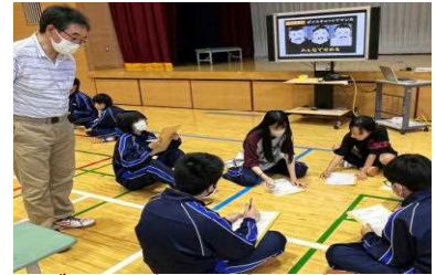
メディア安心講座（7/18）